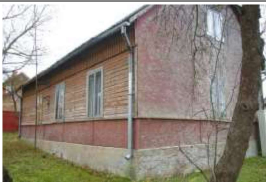
Būve ar kadastra apzīmējumu 6415 004 0075 001