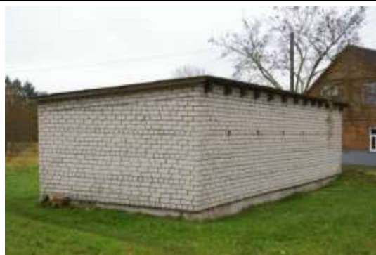
Būve ar kadastra apzīmējumu 6415 004 0075 002