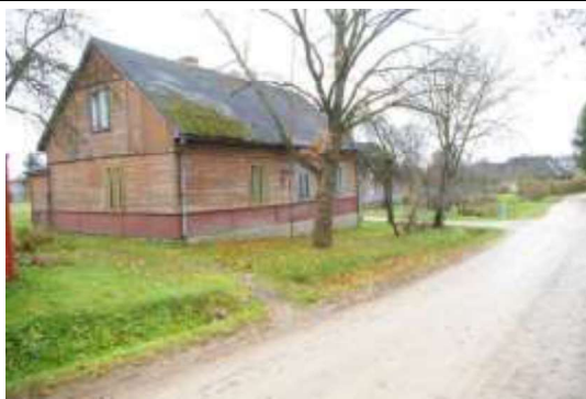
Kopskats no Rīta ielas puses