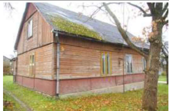
Būve ar kadastra apzīmējumu 6415 004 0075 001