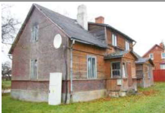
Būve ar kadastra apzīmējumu 6415 004 0075 001