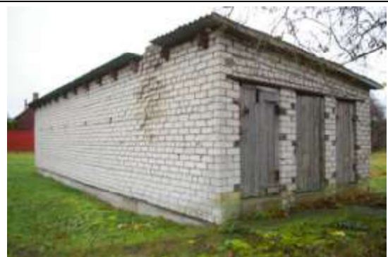
Būve ar kadastra apzīmējumu 6415 004 0075 002