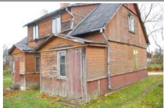
Būve ar kadastra apzīmējumu 6415 004 0075 001